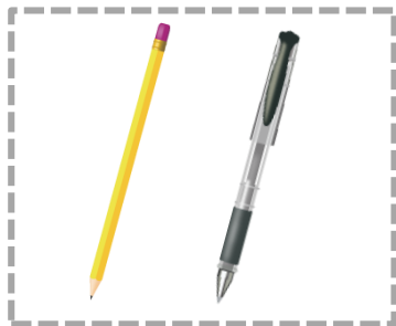
黑色 2B 軟心鉛筆、 黑色墨水的筆